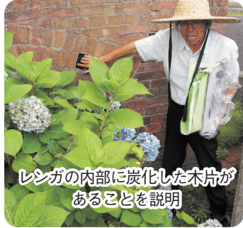
レンガの内部に炭化した木片があることを説明

光海軍工廠宇部分室(元宇部紡績所)の焼け残った壁を内部西側に組み込んで設計されました。図書館そのものが、実は大変貴重な産業・戦争遺構なのです。