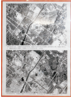
新聞閲覧コーナー近くにあり、寄贈された空中写真

私は今使われているレンガ壁が、造られた当時の工場などの壁にあたるか、昔と現代の地図を重ねる中で特定する事ができました。平和ツアーに参加された方に説明すると一様に驚かれます。「よく来る図書館に空襲の爪跡が残されているなんて、初めて知った。よく残したものだ。」と。文庫本コーナー、新聞閲覧