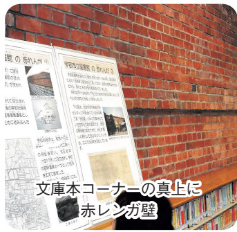
文庫本コーナーの真上に赤レンガ壁

光海軍工廠宇部分室(元宇部紡績所)の焼け残った壁を内部西側に組み込んで設計されました。図書館そのものが、実は大変貴重な産業・戦争遺構なのです。