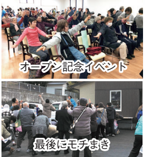
オープン記念イベント

駐車場の舗装もたんぼぼ建設に伴い拡張しました。従来は診療所前に9台分しかありませんでしたが、たんぼぼ前に21台分を増やしました。2月8日にはオープン記念イベントを行いました。100名を超える方