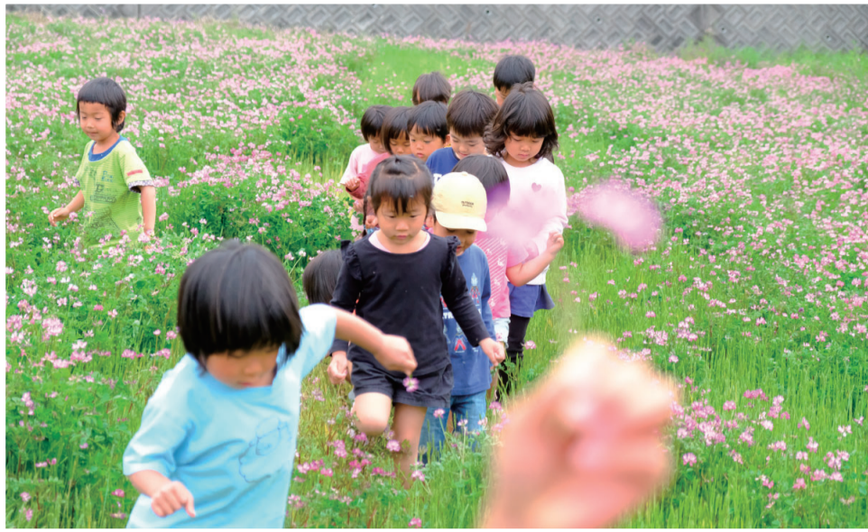
れんげの花が咲いたよとお誘いを受けて田んぼに遊びにいきました。れんげの中を走ったり、かくれんぼしたり、花を摘んだりして楽しみました

健文会が院内保育所として委託している、NPO法人「みらい広場」。子どもたちの園での様子を連載でご紹介します。