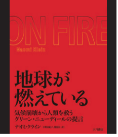
著 ナオミ・クライン 中野 真紀子 訳 関 房江