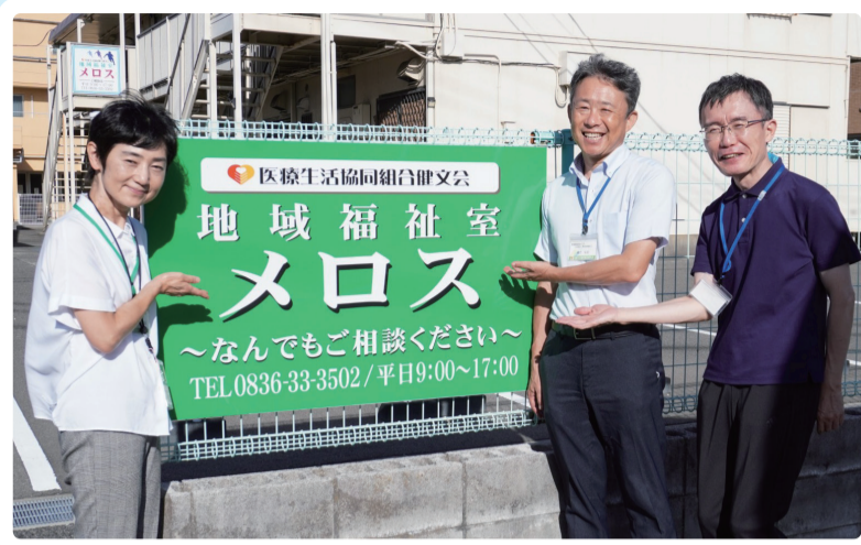
大切にしているのは「個人の尊厳」と困難に向きあう方々への「人としての愛情」

悲しみを浮かべた瞳の中にたくさんの人生を見てきました。「社会的不利」や「不運」から力を失くした方にとって社会は厳しすぎます。自己責任にしないほんの少しの愛情があれば立ち上がることもできるのに、社会は人々にそのゆとりを与えません。