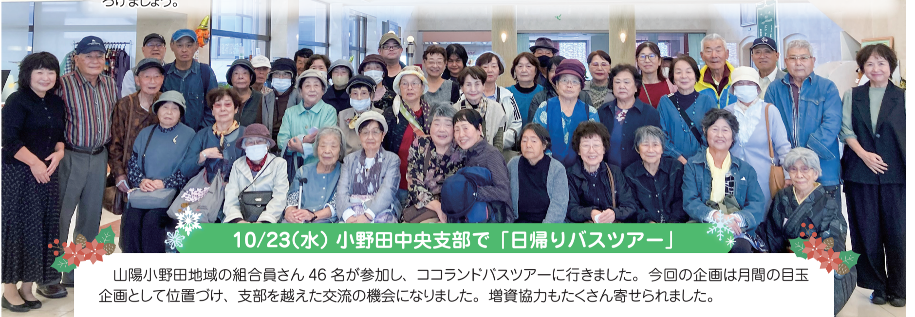
10/23(水) 小野田中央支部で「日帰りバスツアー」

健文会創立50周年のなかで迎えた生協強化月間は、この間、支部では秋のお楽しみ行事やウォークイベント、職員とともに地域に出かけ顔の見える訪問対話、地元イベント行事でのまちかど健康チェック、きつずチャレンジを通じた学校との関係づくりなど、積極的なとりくみがおこなわれています。これからも支部を越えた交流や自治会や行政との幅ひろい連携をつくって、あらたなつながりをひろげましょう。