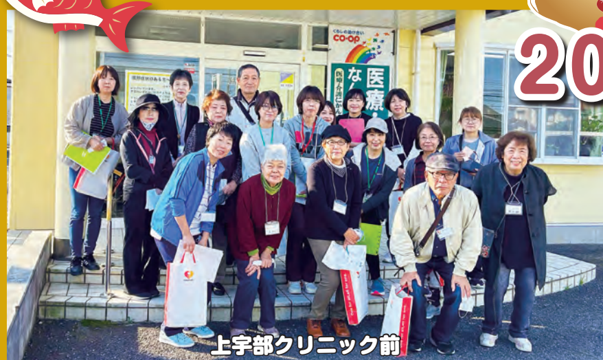
上宇部クリニック前