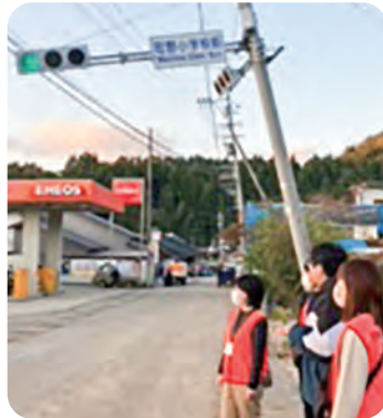
▲地震と水害の被害がそのまま支援が遅れている町

【11月8日】住み慣れた能登を離れ、金沢市内に避難されている独居の方を訪問。健康状態や困りごとなど聴かせていただきました。その後能登へ移動。滞在先の宿泊拠点は少し傾いていました。