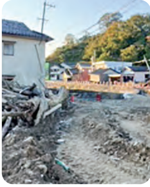
▲地震の後に水害に襲われた跡